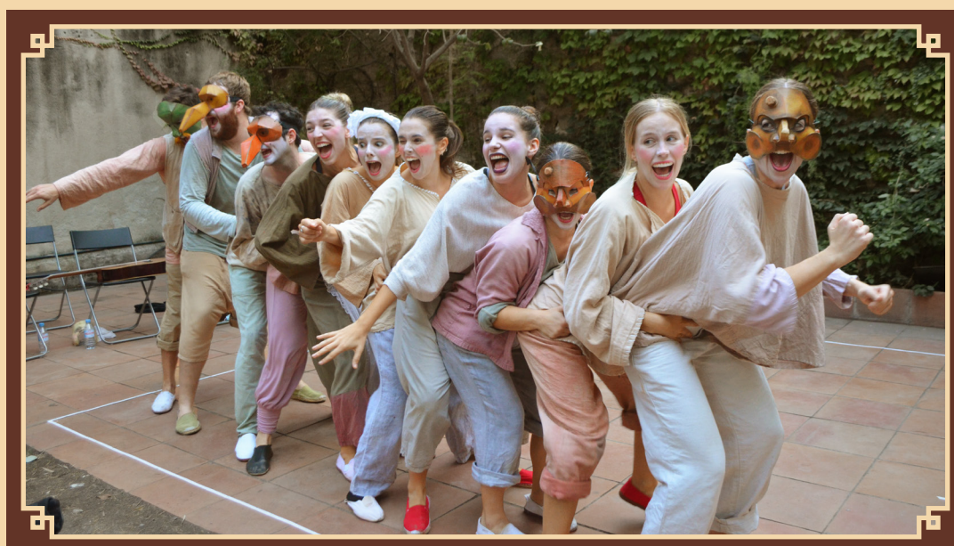
2021 ORFEÓ BADALONÍ